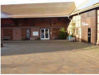
Weg vom Haupteingang zu Schaustall