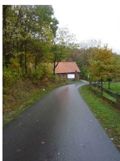
Weg vom Parkplatz zum Haupteingang