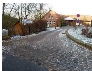
Weg vom Parkplatz zum Haupteingang