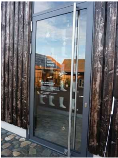
Eingangstür Ausstellung "Es lebe die Vielfalt"