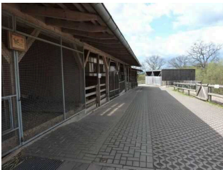
Weg von Ausgang Schaustall zu Haupteingang