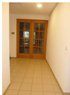
Weg von Kasse zu Tagungsraum