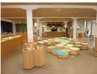
Weg von Kasse zu Bestelltresen