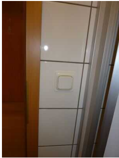
Mantelbogen visuell taktile Gestaltung