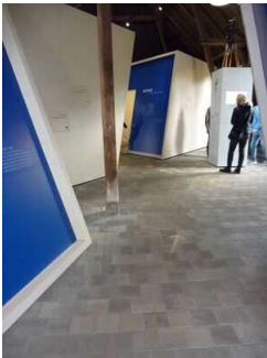
Ausstellungsraum "Natur bewahren"