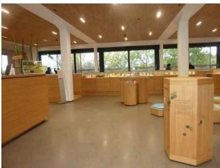
Weg von Kasse zu Rampe (Sitzbereich Restaurant)