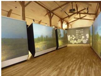
Ausstellungsraum 1. Etage