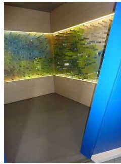
Ausstellungsraum "Natur bewahren"