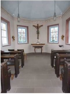
Franz von Assisi-Kapelle