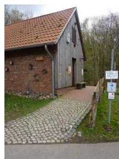
Weg zwischen Haupteingang und Bienenhaus