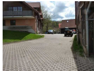
Weg von Ausgang Schaustall zu Haupteingang