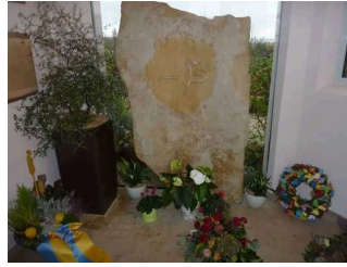
Franz von Assisi-Kapelle