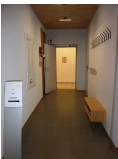
Weg von Kasse zu Tagungsraum