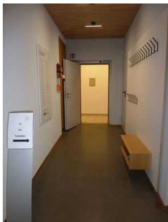
Weg zu barrierefreiem WC (EG) ab Kasse