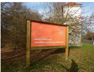
Beschilderung Gut Herbigshagen

Es sind keine Informationen vorhanden, die der Orientierung dienen und aus Wörtern bestehen.