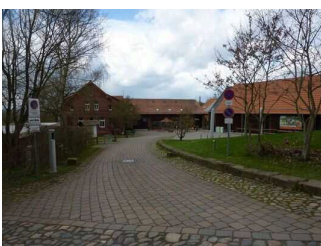
Weg von Haupteingang zu Bienenhaus