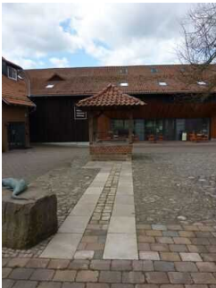
Brunnen (Exponat außen)