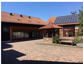
Gut Herbigshagen der Heinz Sielmann Stiftung