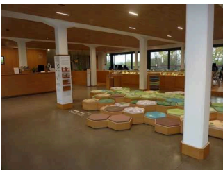
Weg von Eingangstür zu Kasse