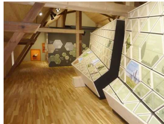
Ausstellungsraum 1. Etage