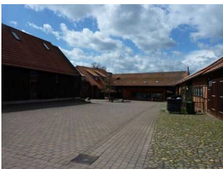
Weg von Ausgang Schaustall zu Haupteingang