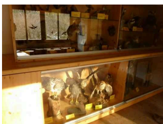
Exponat im Bienenhaus

Informationen werden schriftlich vermittelt.