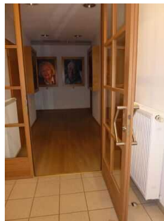
Weg zu barrierefreiem WC (EG) ab Kasse