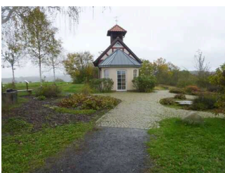
Franz von Assisi- Kapelle