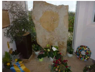
Franz von Assisi-Kapelle