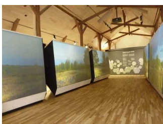
Ausstellungsraum 1. Etage