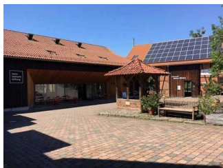
Gut Herbigshagen der Heinz Sielmann Stiftung