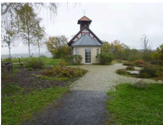
Franz von Assisi-Kapelle