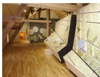
Ausstellungsraum 1. Etage